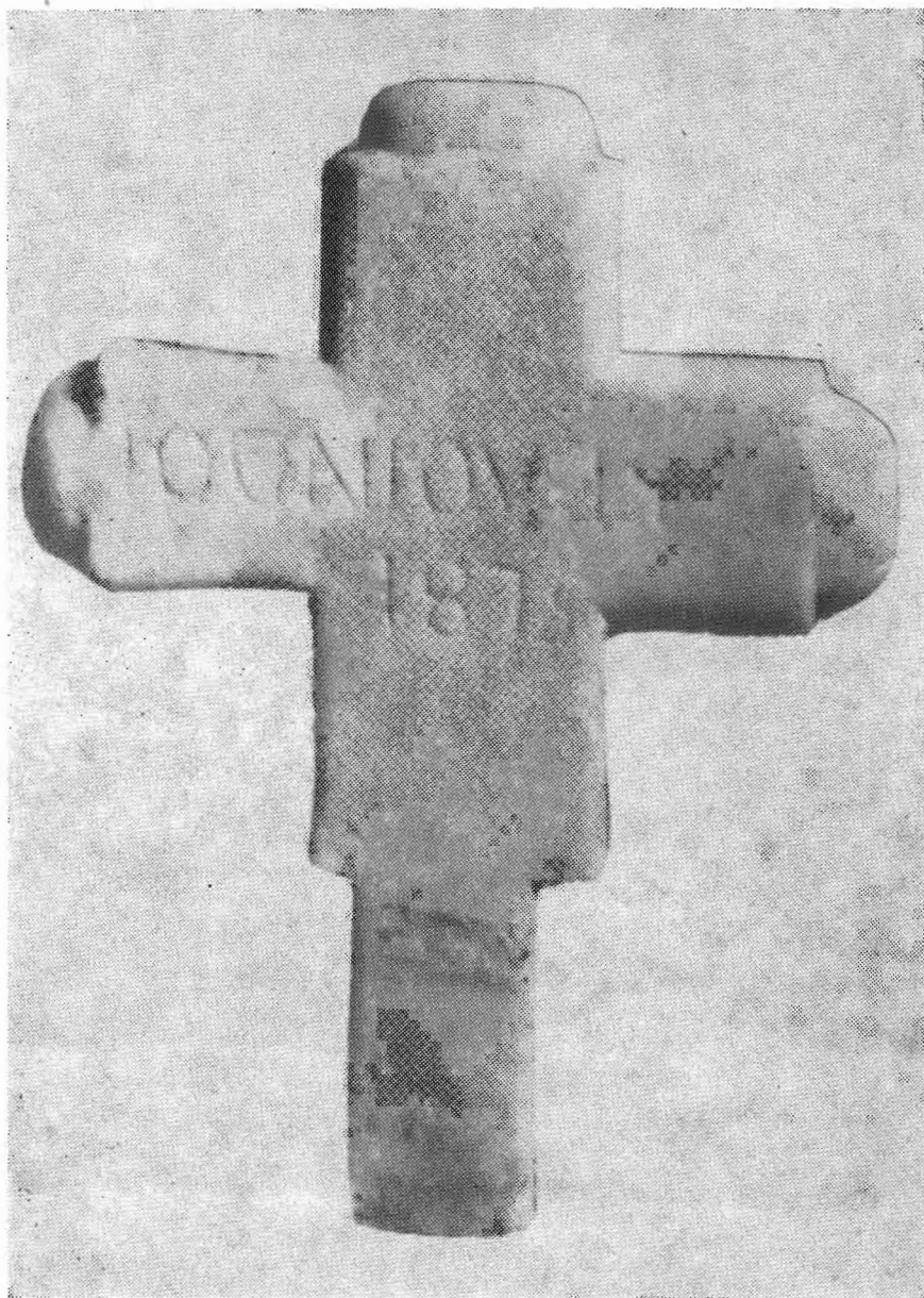
Εικών 4. Ἡ ὀπισθία ὄψις τοῦ μαρμαρίνου σταυροῦ.