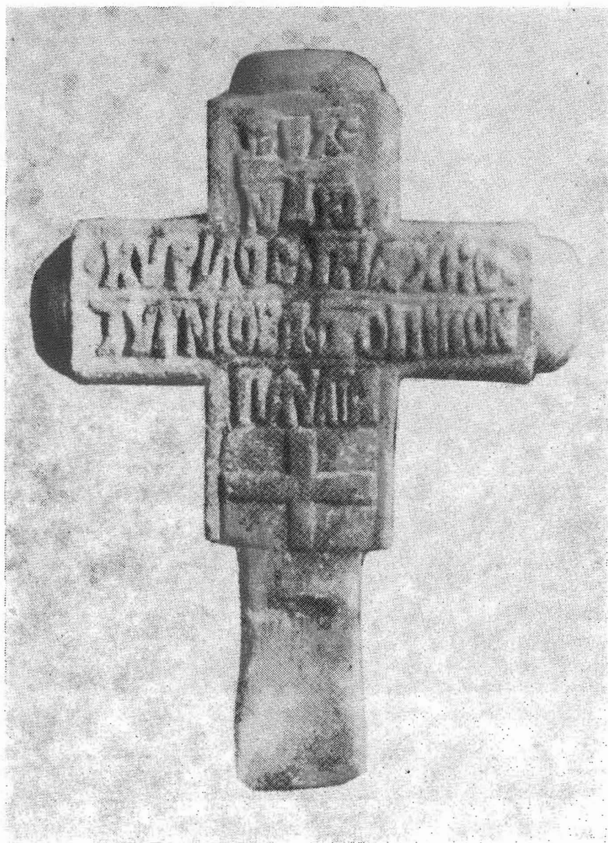
Εἰκὼν 3. Ἡ ἐμπροσθία ὄψις τοῦ μαρμαρίνου σταυροῦ.