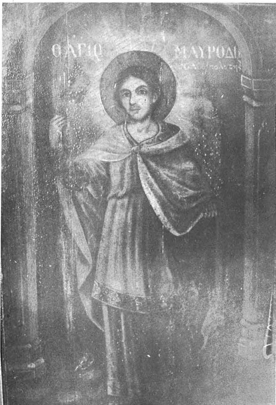
Φορητὴ εἰκόνα (ἔτ. 1919) τοῦ ἁγίου Μιχαὴλ τοῦ Μαυροειδῆ στὸ ναὸ τῆς Κοιμήσεως τῆς Θεοτόκου Ταύρου Ἀττικῆς. Προέρχεται ἀπὸ τὰ κειμήλια τῶν προσφύγων τῆς Μικρασίας.