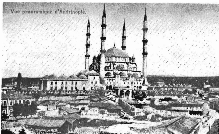
Ἡ Ἀδριανούπολη στὰ τέλη τοῦ 19ου αἰ. Διακρίνεται καὶ κυριαρχεῖ τὸ ἐπιβλητικὸ τέμενος (τζαμί) τοῦ Σελίμ Β' (1566-1574), κτίσμα τῆς ἐποχῆς τοῦ σουλτάνου αὐτοῦ.