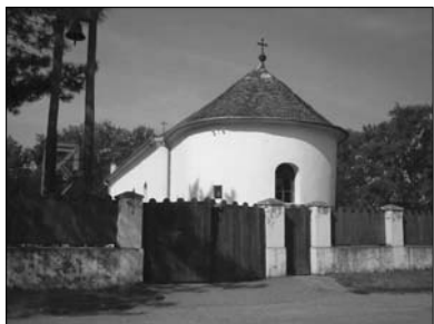
ΠΙΝΑΚΑΣ Δ': Τὸ καθολικὸ τῆς μονῆς Kurinic.