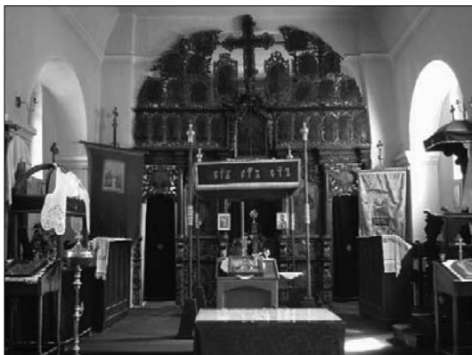
ΠΙΝΑΚΑΣ Ε': Ἐσωτερικὴ ἄποψη τοῦ καθολικοῦ τῆς μονῆς Kurinic.