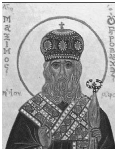
ΠΙΝΑΚΑΣ Β': Ὁ Ἅγιος Μάξιμος Ούγγροβλαχίας (Βλ: Ἀγαθαγγέλου (ἐπισκ. Φαναρίου), Συναξαριστὴς τῆς Ὁρθόδοξου Ἐκκλησίας , ὁ.π., σ. 220).