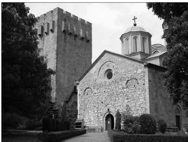
ΠΙΝΑΚΑΣ Γ': Τὸ καθολικὸ τῆς μονῆς Manasija.