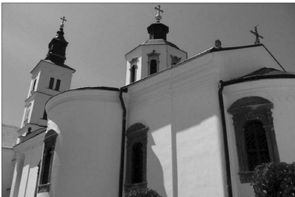
ΠΙΝΑΚΑΣ ΣΤ': Τὸ καθολικὸ τῆς μονῆς Crusedol.