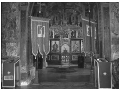
ΠΙΝΑΚΑΣ Ζ': Έσωτερική άποψη του καθολικού της μονής Crusedol.