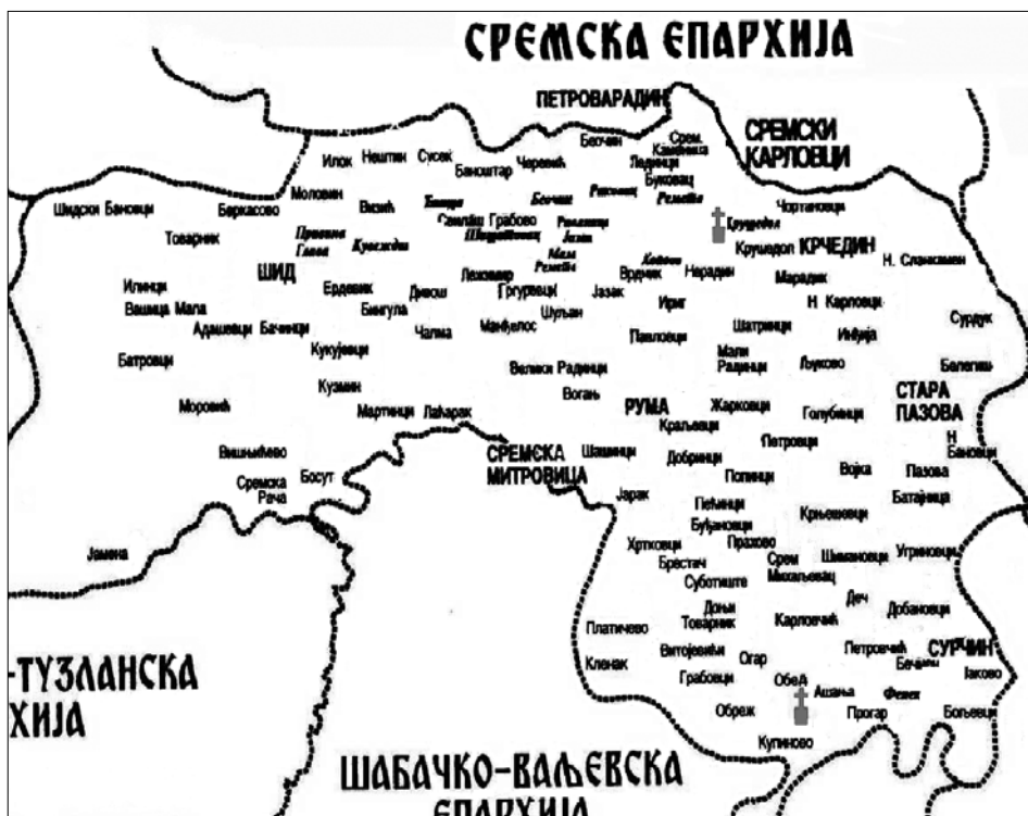
ΠΙΝΑΚΑΣ Θ': Χάρτης τμήματος της Σερβίας, όπου διακρίνονται οι μονές Kurpinic (νότια) και Crusedol (βόρεια).